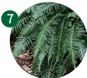
7 弓锯蕨 巴利斯乌毛蕨 澳大利亚铯蕨