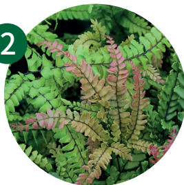
玫瑰色铁线蕨毛叶铁线蕨