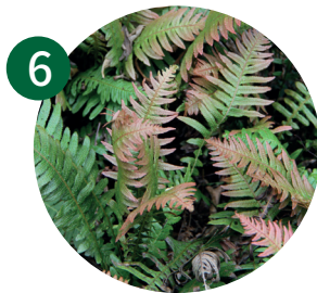
6 刺铯蕨新荷兰乌毛蕨 铯蕨