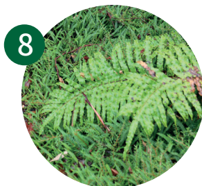
8 高山水蕨羽海乌毛蕨