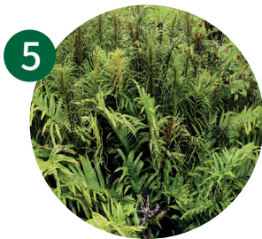
5 沼泽kiokio 小乌毛蕨