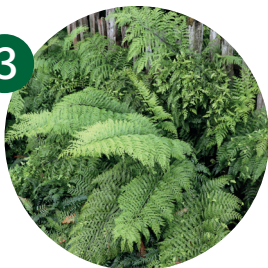
母鸡和小鸡蕨芽胞铁角蕨